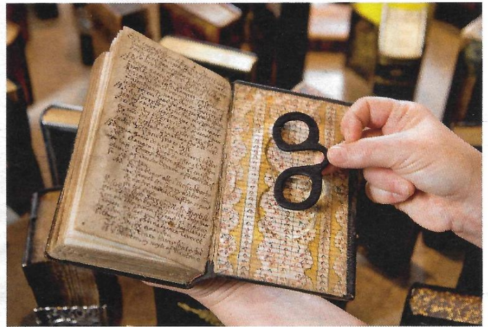
Salmebog fra 1779 med fordybning til briller.