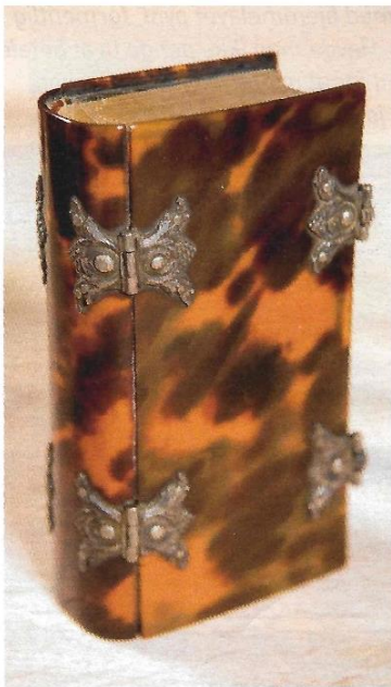
Salmebog med bind af skildpaddekjold. Fra 1708 og formentlig fra Holland.

De gjorde noget ud af salmebøgerne i gamle dage.